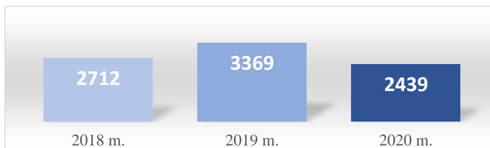
2 pav. Baigusiujų mokymus (ne biudžeto lėšomis) asmenų skaičiaus kaita